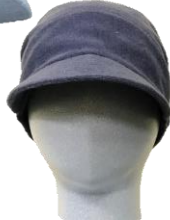
コンパクトなシルエット