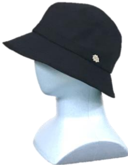
★ #23 ネイビー